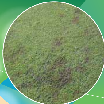
カーブラリア葉枯病