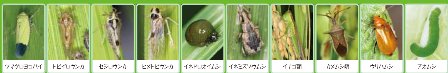
ツマグロヨコバイ