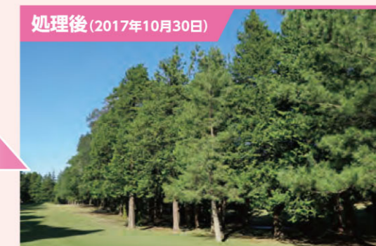
無処理のマツの葉